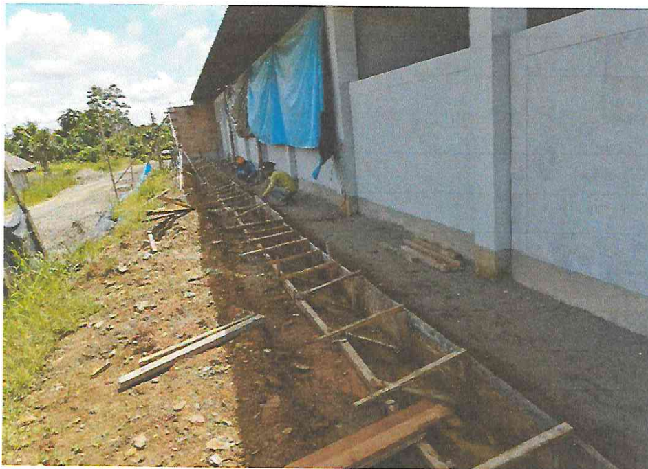
Foto N° 13: Vista del encofrado de las veredas del lado exterior del módulo A en la obra "Mejoramiento y Equipamiento del servicio Educativo N 62200 Barrio Carabanchel - San Lorenzo, Distrito Barranca, Provincia Datem Del Marañón - Loreto"