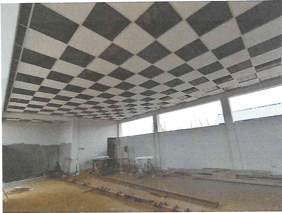
Foto N° 01: Vista de colocado del cielo raso en SUM del módulo B en la obra “Mejoramiento y Equipamiento del servicio Educativo N 62200 Barrio Carabanchel - San Lorenzo, Distrito Barranca, Provincia Datem Del Marañón - Loreto”.