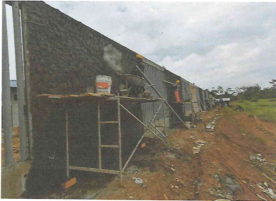
Foto N° 11: Vista del tarrajeo frotachado del cerco perimétrico en el tramo III parte i exterior en la obra "Mejoramiento y Equipamiento del servicio Educativo N 62200 Barrio Carabanchel - San Lorenzo, Distrito Barranca, Provincia Datem Del Marañón - Loreto"