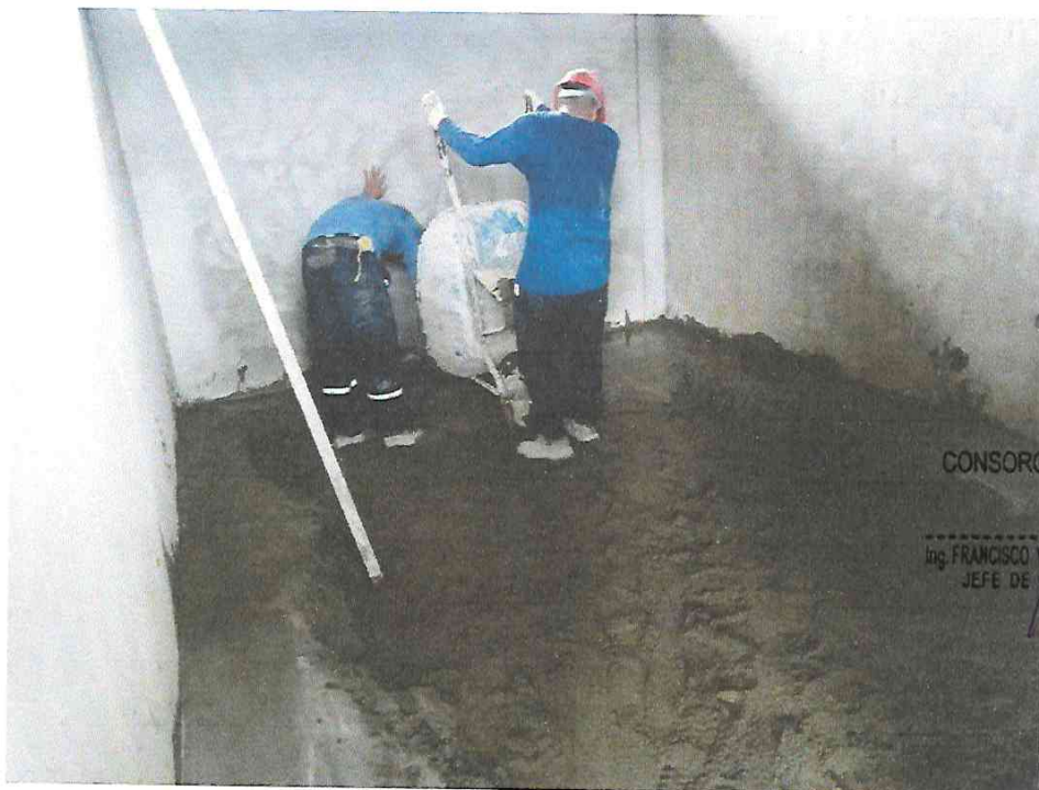
Foto N° 12: Vista del vaciado de mortero 1:4 en contrapiso del módulo E en la obra "Mejoramiento y Equipamiento del servicio Educativo N 62200 Barrio Carabanchel - San Lorenzo, Distrito Barranca. Provincia Datem Del Marañón - Loreto"