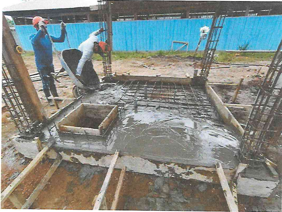
Foto N° 07: Vista del vaciado de techo de la cisterna en la obra "Mejoramiento y Equipamiento del servicio Educativo N 62200 Barrio Carabanchel - San Lorenzo, Distrito Barranca, Provincia Datem Del Marañón - Loreto".