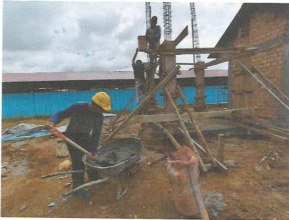
Foto N° 9: Vista del vaciado de las columnas del tanque elevado en la obra "Mejoramiento y Equipamiento del servicio Educativo N 62200 Barrio Carabanchel - San Lorenzo, Distrito Barranca, Provincia Datem Del Marañón - Loreto".