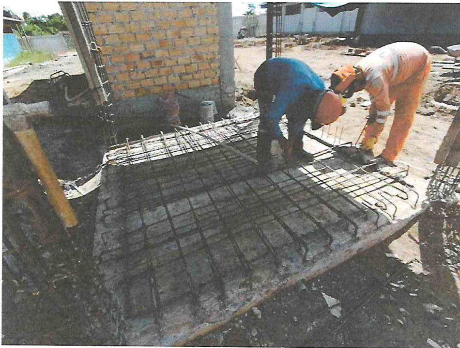
Foto N° 05: Vista del encofrado inferior del techo de cisterna en la obra "Mejoramiento y Equipamiento del servicio Educativo N 62200 Barrio Carabanchel - San Lorenzo, Distrito Barranca, Provincia Datem Del Marañón - Loreto"