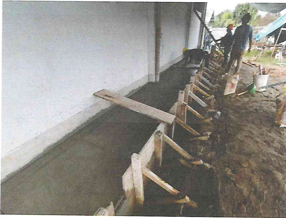
Foto N° 03: Vista del bruñado de veredas del módulo B- tramo posterior en la obra "Mejoramiento y Equipamiento del servicio Educativo N 62200 Barrio Carabanchel - San Lorenzo, Distrito Barranca, Provincia Datem Del Marañón - Loreto".